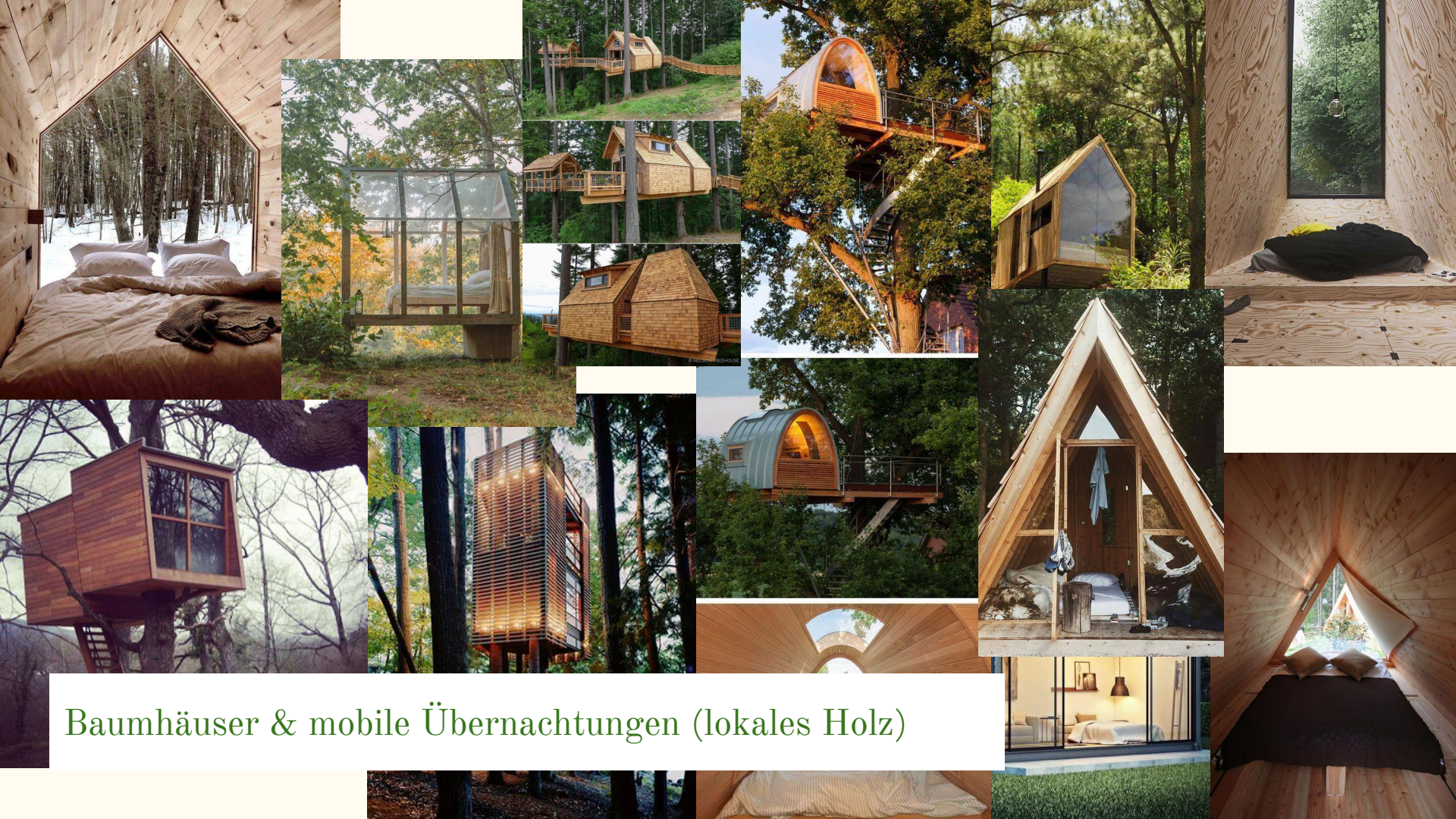
Baumhäuser & mobile Übernachtungen (lokales Holz)